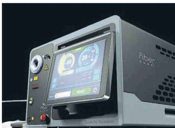
DISPOSITIVO FIBER DUST