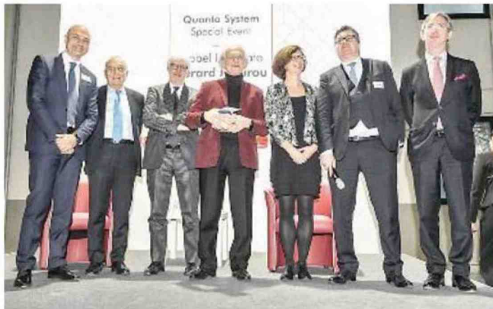
FOTO DI GRUPPO Dirigenti e autorità posano con lo scienziato