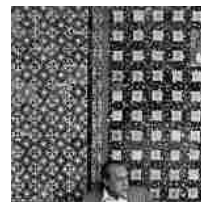
Libri, nuova edizione di "Ore di Spagna" di Leonardo Sciascia: fotografie di Ferdinando Scianna