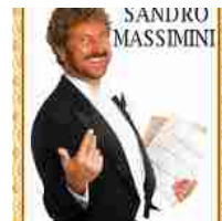
TEATRO OLIMPICO, IL 9 GIUGNO TORNA L'OPERETTA - TRIBUTO A SANDRO MASSIMINI