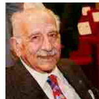
Teatro Parioli, stagione 2016-17. De Filippo: "Il Teatro non è un Museo ma un laboratorio"