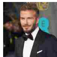
SULLE SPIAGGE 8 DONNE SU 10 PREFERISCONO LO "SHAVED-MAN" DEPILATO: DAVID BECKHAM IL PIÙ DESIDERATO