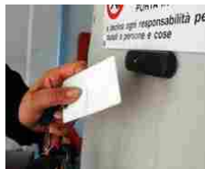
Furbetti del cartellino all'Asp di Cosenza, ogni giorno assenti dal