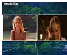
Le confessioni della figlia di Eva Henger: "Da piccola piangevo"