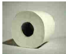
'Rotolone' della discordia, la Cassazione riapre la