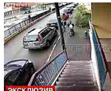
Ragazzino si lancia dal 14esimo piano: salvo. Volo ripreso dalle