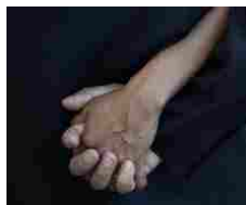
Madre choc in Usa: "Amo mio figlio e voglio un bimbo con"