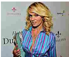
Justine Mattera, il reggiseni di pizzo blu manda in tilt i fan su