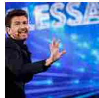
AMICI 15: quarto giudice Carlo Conti, ospiti Gianna Nannini, Alessandra Amoroso, Baby K e Giusy Ferreri e Alessandro Siani