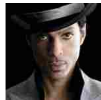
Musica, a 57 anni è morto Prince "icona creativa e artista elettrizzante"