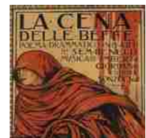
Teatro alla Scala, dal 3 aprile al 7 maggio "La cena delle beffe" di Umberto Giordano. Dirige Carlo Rizzi, regia Mario Martone