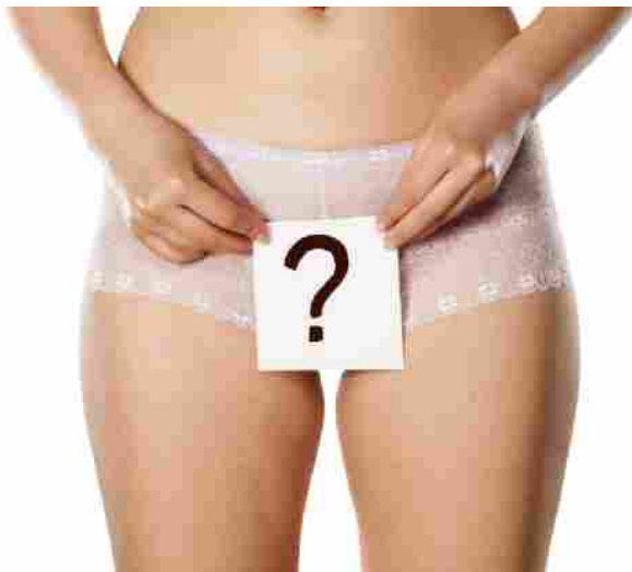
Ritocchino alla vagina, sempre più richiesto