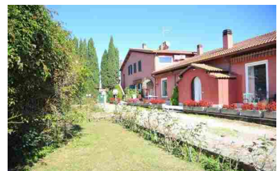
Villino, via Antonio Battilocchi