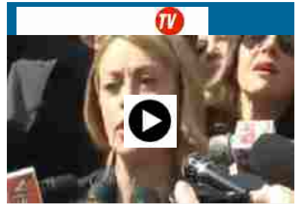
Meloni alla fan: "Calmati, arrivo! Me fai veni' l'ansia!"