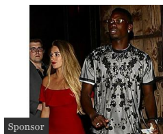
Les femmes des joueurs de l'équipe de France (Reprise de volée)