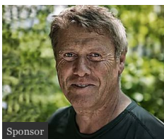
Prostate : 9 hommes sur 10 commettent cette erreur fatale... et vous ? (Cell'innov)