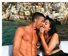
Chi è Georgina, la fidanzata di CR7