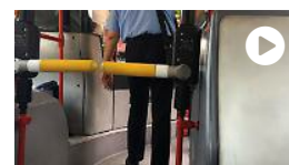
Autobus romani, ecco i tornelli anti evasione sulla linea 51