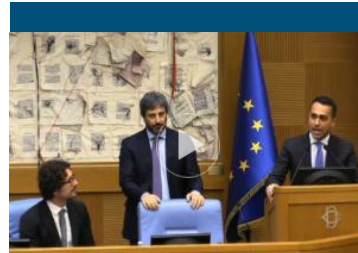
Di Maio: chi vota Casellati al Senato, vota Fico alla Camera