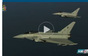
Paura in Lombardia, Eurofighter intercettano Boeing AirFrance