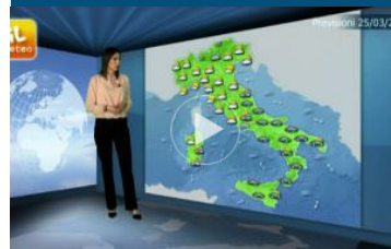
Previsioni meteo per domenica, 25 marzo